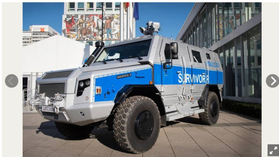
Der 17 Tonnen schwere gepanzerte Wagen von Rheinmetall dient den sächsischen Spezialeinheiten. Wegen Stickereien auf seinen Sitzbezügen war er bei der Vorstellung Ende 2017 sofort in die Kritik geraten. Die an NS-Ästhetik erinnernden Inschriften in Frakturschrift wurden daraufhin entfernt.

Das kann VONSEITEN DES VOLKES mit BRUTALER GEWALT (BÜRGERKRIEG) geschehen, aber das kann auch FRIEDLICH DURCH VERTRAGSGESPRÄCHE ÜBER DAS GG geschehen indem DER STAAT = DIE STAATLICHE GEWALT = DIE AUSSER KONTROLLE GERATENEN STAATSDIENER vorher nachdenken und in VERTRAGSGESPRÄCHE ÜBER DAS GG widerstandslos einwilligen und sich einsichtig diesem VERTRAGSGESPRÄCH öffnen. Dass DER STAAT = DIE STAATLICHE GEWALT gegen DAS DEUTSCHE VOLK aufrüstet ist jedem sehenden Menschen klar. DIE DEUTSCHEN WERDEN MEHR UND MEHR ENTWAFFNET, und schon das ist Aufrüstung. Des Weiteren werden Anschaffungen für die Polizei gemacht, und auch das ist Aufrüstung gegen das DEUTSCHE VOLK. Offensichtlich rechnet DER STAAT = DIE STAATLICHE GEWALT mit offenem, und gewaltsamen Widerstand, vielleicht sogar mit Bürgerkrieg. Warum wohl? Womit rechnet ihr? Wozu braucht die POLIZEI Panzer? Wer deeskalieren will darf keine Panzer anschaffen, aber das ist offensichtlich nicht die satanisch verlogene Absicht des STAATES.